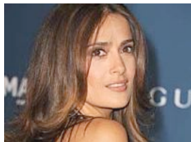
Salma Hayek: "Matteo mi manda in estasi"