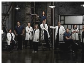
Cristina lascia Grey's Anatomy: tutte le attrici "intrappolate" nelle serie tv